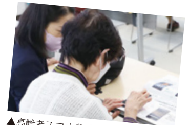
▲高齢者スマホ教室

市内の農業者、商店街、公共交通事業者、介護・障がい者施設に対する補助金を交付。 物価高騰の影響が大きい事業者を重点的に支援 ！