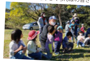
▲かぼすちゃんと記念撮影